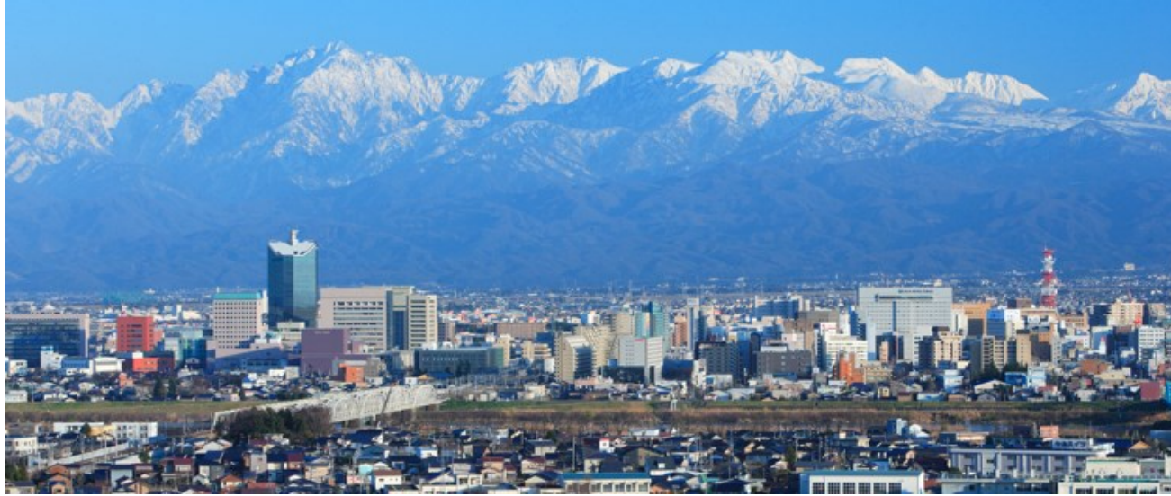
立山連峰と富山市内