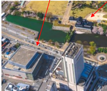
富山国際会議場と富山城